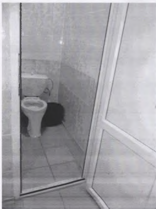
Фото № 11