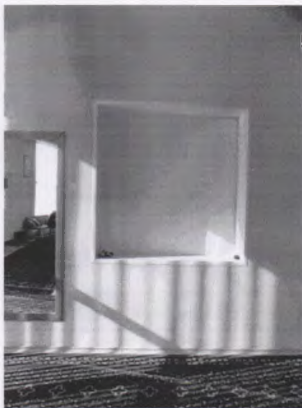
Фото № 9