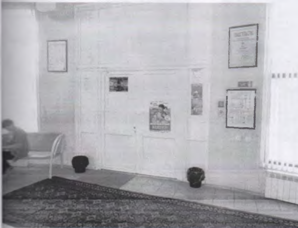
Φοτο Νο 6