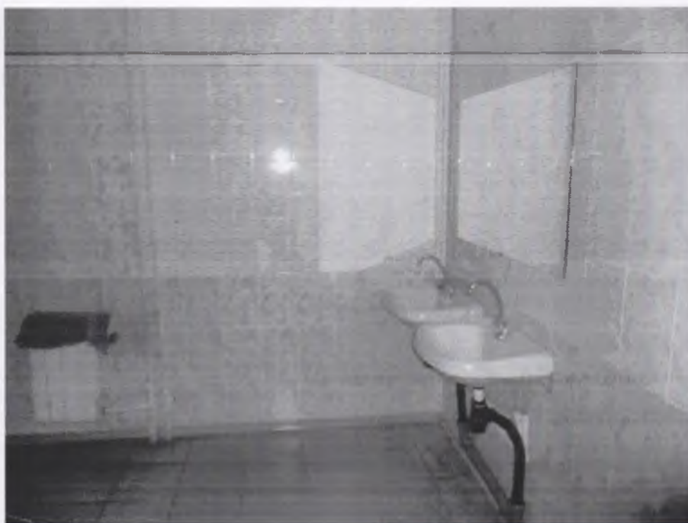
Фото № 10