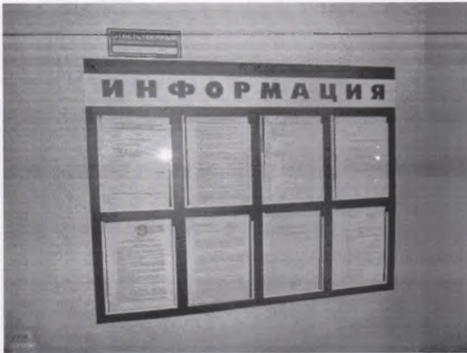
Фото № 12