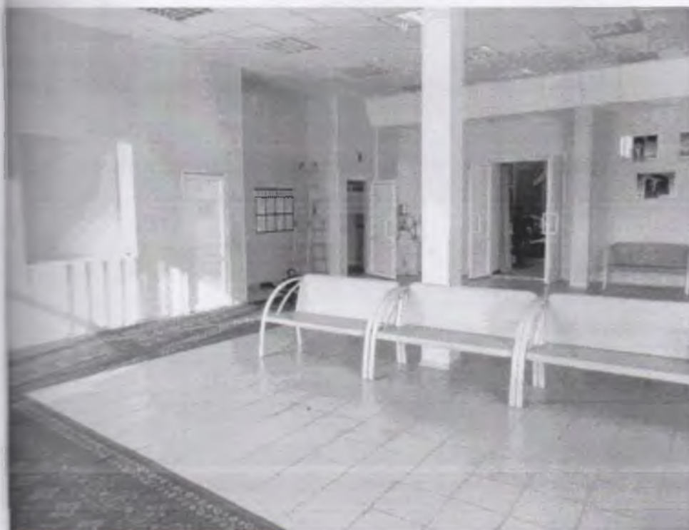
Фото № 4