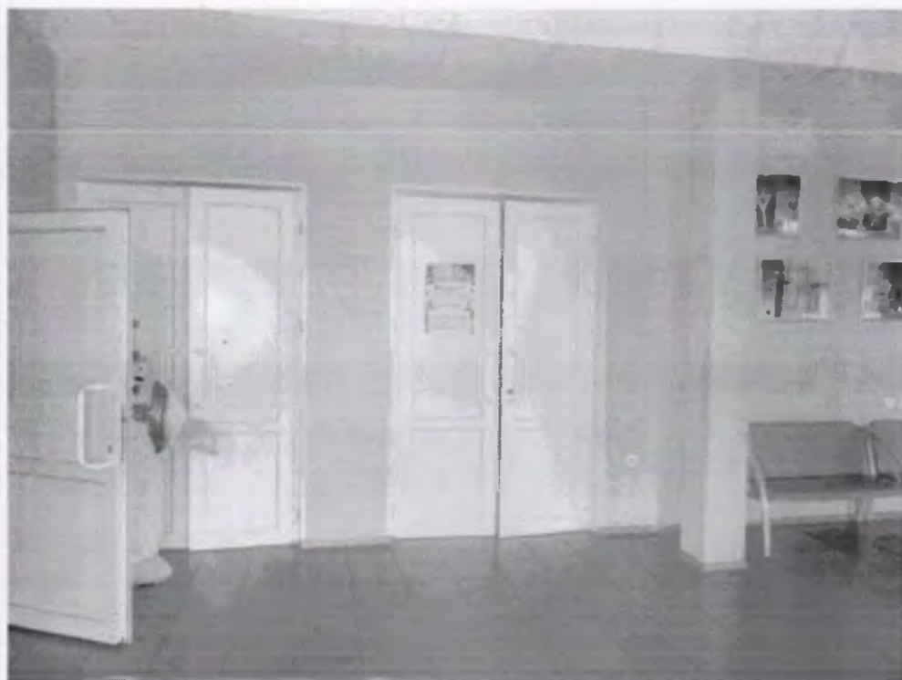
Фото № 7