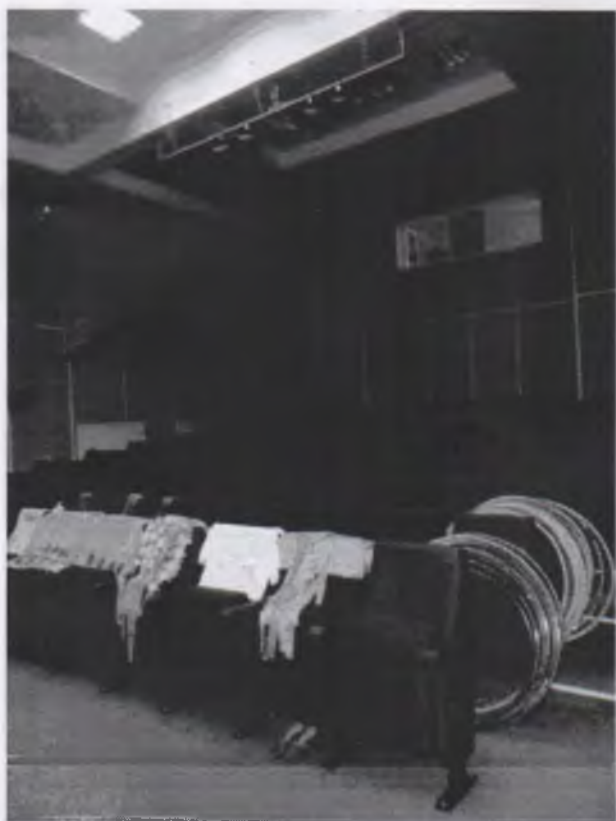
Фото № 8