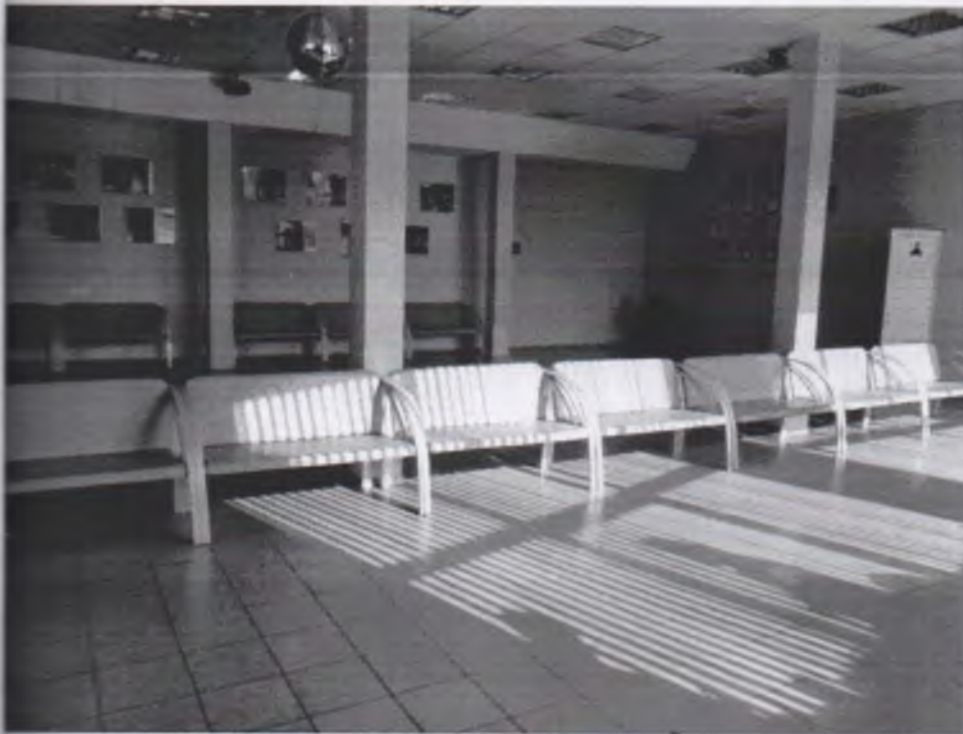
Φοτο Νο 5